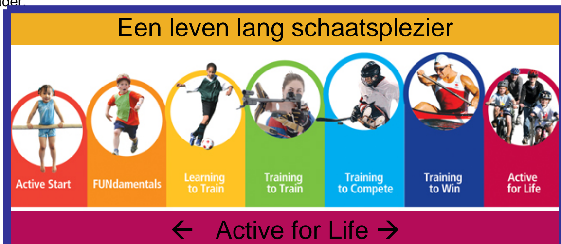
1.1 Een leven lang genieten van schaatsen (1 afbeelding van bovenstaand model (incl. pijltjes zie BS, schaatsspecifiek)